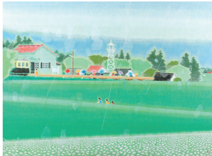
《スグニ雨ハ止ムダロウ》2015 箱根・芦ノ湖 成川美術館蔵