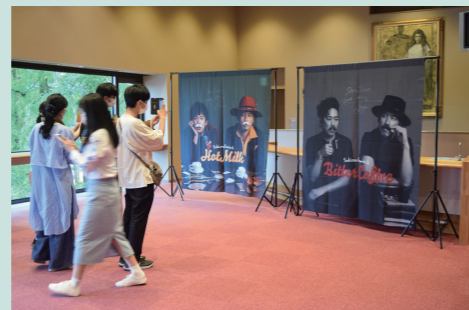
スキマスイッチ 会場の様子