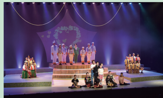
2021年度公演 「メリーゴーランド～いちばん大切なもの～」より

毎年、大きな感動を呼んでいるとなみミュージカルキッズ主体のオリジナルミュージカル。今年度の公演は、「ちいさなちいさなお星さま」。2013年に公演された舞台をリメイクしてお届けいたします。