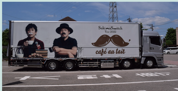
スキマスイッチ ツアートラック

6月23日（木）に砺波市文化会館の主催事業として、大人気デュオ、スキマスイッチのコンサートを開催しました。代表曲「全力少年」では、YOUTUBE生配信が行われ、視聴者も一体となったステージが繰り広げられました。また、5月21日（土）には共催事業として、アカペラブームの火付け役となった5人組ボーカルグループ、ゴスペラーズがコンサートを開催し、美しいハーモニーだけでなく、キレのあるダンスでも魅了しました。どちらのアーティストも、砺波でコンサートを行うのは初めてで、チケットは完売し、客席は、オープニングからスタンディングで、大変な盛り上がりでした。