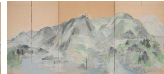
島田四郎《庄川峡右岸図》1954