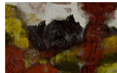
清原啓一《ハツ峰の秋》1994