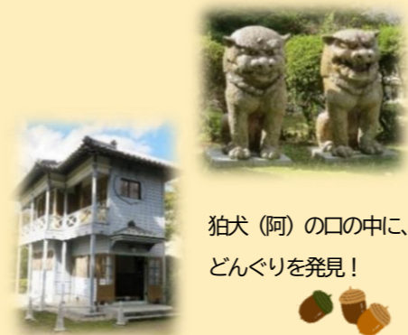
狛犬(阿)の口の中に、 どんぐりを発見!

自然豊かな平戸橋公園の一角に位置する豊田市民芸館。参加者の大半は、館全体が常設展示の第3民芸館へと直行。その後、駐車場へと戻る道すがら、土蔵・茶室・第1、第2民芸館等の外観を見学。豊田市内に現存する唯一の明治時代の洋風建築物(旧井上家住宅西洋館)では、脇にあった大きな陶製狛犬に目がいき、後から写真を見て見所のひとつである、玄関上のカブの形をした窓枠を見逃していたことに気づきました。(銀行として利用されていた背景から、株が上がるという縁起を担いだ装飾と言われている。)