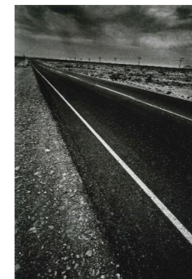
ジャンルー・シーフ 《ラスベガス》1962