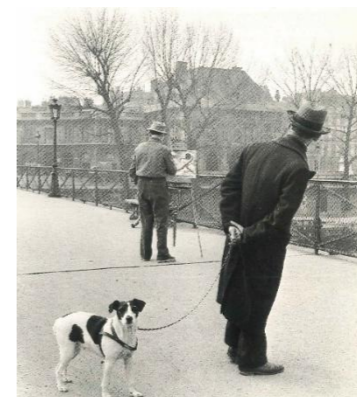
ロバール・ドアノー 《芸術橋のフォックスステリア》1953