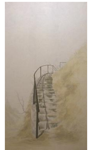
広田南世《在る日の風景》2007